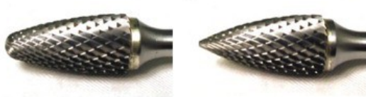
Trädform-rund topp Trädform-spetsig topp