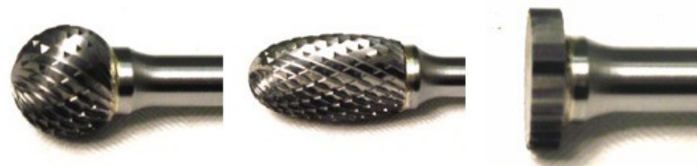
Kula Oval form Rim form