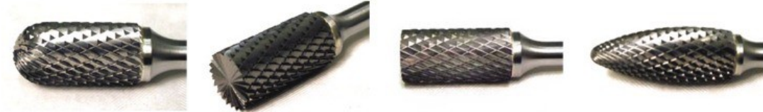
Cylinder-rund topp Cylinder- med ändskär Cylinder-utan ändskär Flamform

Roterande filar som håller absolut högsta klalitet. Filarna är tillverkade av volframkarbid och är värmehärdade för att tåla extremt tuff användning och har en mycket lång livsläng. Filarna är dubbelhugna för att undvika igensättning.