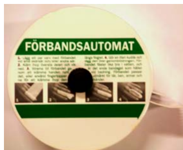
Förbandsautomat för 6cm x 500cm