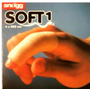
6cm x 500cm