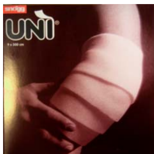
9cm x 500cm tryckförband